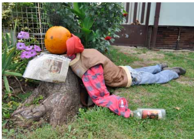
Aktuální metylakoholové téma bylo k vidění na Ivaňské ulici

Nejllepší dýňové kreace byly vybrány ze čtyř kategorií: