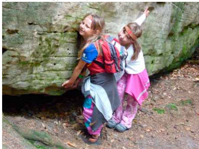
Postavit pyramidu Boha Slunce vyžadovalo námahu