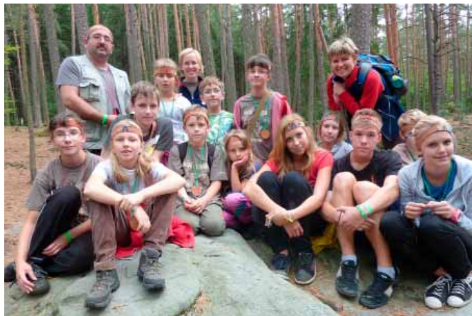
Sokoláci v Budislavi coby Aztékové a Inkové

Již počtvrté jsme pořádali pro naše cvičence akční výlet v Budislavi u Litomyšle. v táboře PS M. Sedláčkové. Tentokrát jsme bojovali o pyramidu Boha slunce.