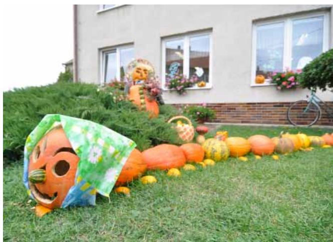
Za sestavu se stonožkou si děti a učitelky ze školky vysloužily první cenu.

První ročník Vranovického dýňování přinesl především neotřelou výzdobu v místních ulicích. Hráli si velcí i malí a projížďka nebo procházka obcí se stala zábavnější. Častým obrázkem byly nadšení cykloturisté, kteří projížděli obcí a zastavovali u rozsáhlejších dýňových výtvorů, aby si je prohlédli zblízka.