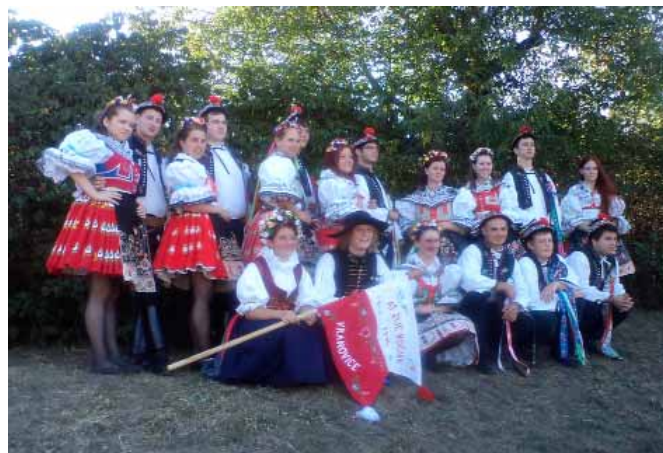
Letošních hodů se účastnilo devět krojovaných párů.

Pondělní zábavu s hudební skupinou Fantazie navštívilo 304 návštěvníků.