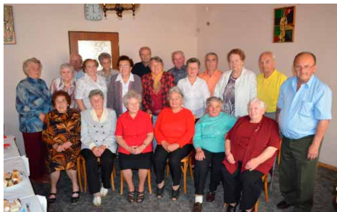
Vranovičtí osmdesátníci se setkali v dobré náladě