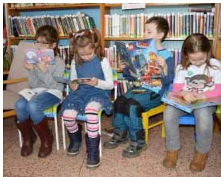
Mezi prvními navštívili knihovnu se svými učiteli žáci prvních tříd základní školy