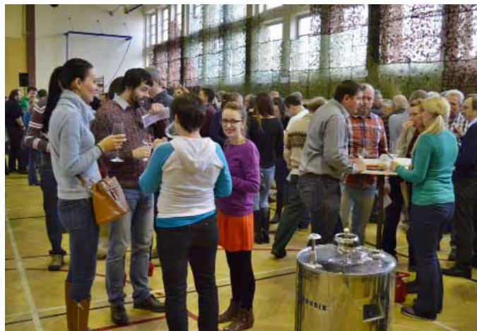
Výstavu spojenou s koštěm navštívilo více než pět stovek příznivců dobrého vína.