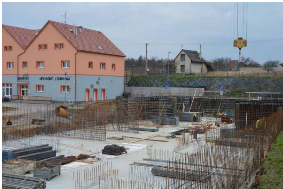
Během jednoho roku vyroste v Dolíněch bytový dům. Nabídne moderní bydlení v atraktivní lokalitě především mladým rodinám.

Malé připomenutí počátku devadesátých let: nebyla kanalizace, nebyl