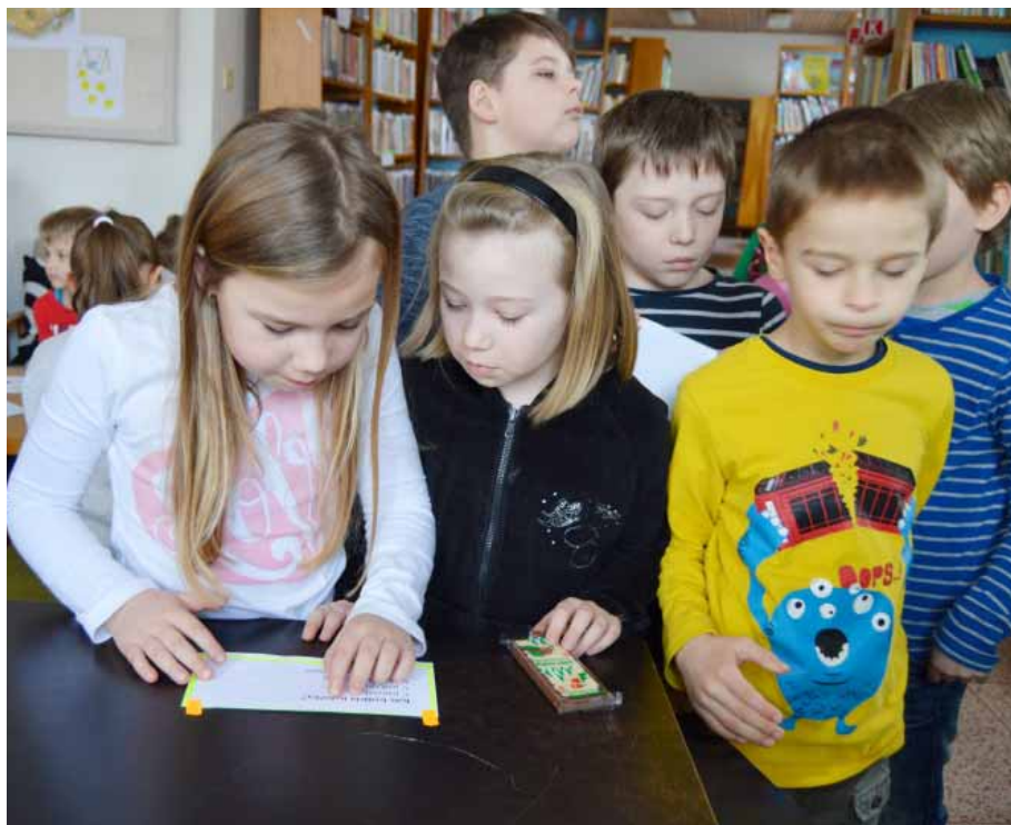
Prvníci prokázali, že ačkoli do konce školního roku zbývají ještě tři měsíce, už dokáží přečíst jednoduché texty