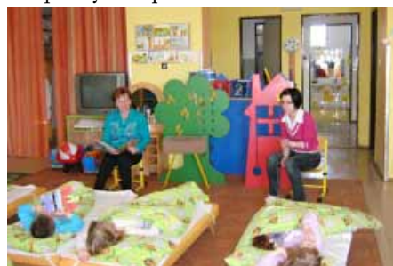
Roli pohádkových babiček si užívaly děti i seniorky.

Dětem z mateřské školky ve Vranovicích jsme od 14. do 18. 3. 2016 četly pohádky před spaním. Členky klubu se střídaly v jednotlivých třídách a uspalily děti pohádkou.