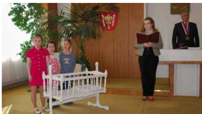
Malé občánky přivítaly mezi sebe také děti z mateřské a základní školy