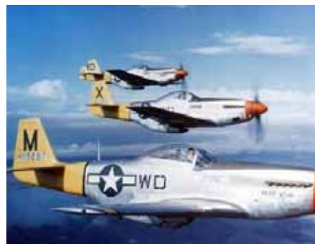
Obrázky ukazují stíhací North American P-51 Mustang, aktera leteckých bojů nad Vranovicemi z americké strany. Souboj z 11. října 1944 připomíná Mustang s příčnými, červenými pruhy na směrovce označující 31. Fighter Group, 1. duben 1945 zase žlutá směrovka Mustangů 52. Fighter Group (anglicky Yellowtails).