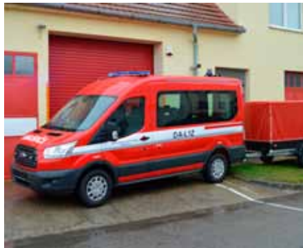
Nové vozidlo s přívěsným vozíkem má od listopadu jednotka dobrovolných hasičů ve Vranovičích

Vranovičtí hasiči se dočkali. V minulých dnech dostali nové auto. Je jím dodávka Ford Tranzit Kombi za 880 tisíc korun. Nahradila starou Avii z roku 1987.