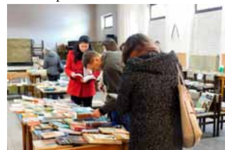
Na prvním bazaru našlo nové majitele šest stovek knih.

Lesní školka Vranovice, z.s. uspořádala v sobotu 12. listopadu velice úspěšný bazar knih. Zhruba 20 dárců darovalo přes 600 knih.