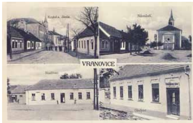
Reprofoto historické pohlednice Vranovic z počátku první republiky zachycuje kostel se školou, hostinec a místní obchod