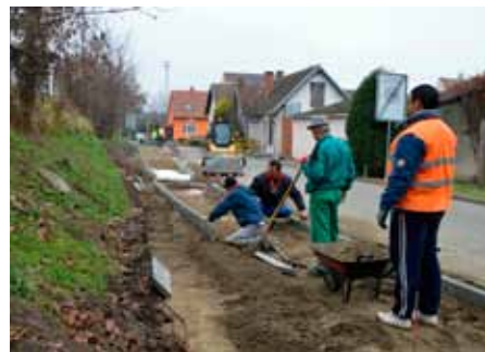
Zbrusu nový chodník ústící k přechodu pro chodce u viaduktu pod železniční tratí a nové chodníky před svými domy budou mít obyvatelé ulice Sadová. Práce by měly být hotovy do poloviny měsíce prosince