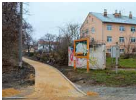
Novou zámkovou dlažbou se pyšní ulička spojující ulici Pouzdřanskou pod železniční tratí s nádražím

Součástí Vize vzdělávání je i celoživotní vzdělávání. Již druhým