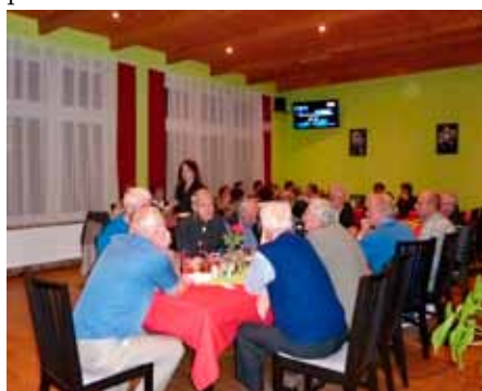
Setkání některých spolužáků po letech potěší

na které rádi vzpomínáme, na vranovická místa, která se za tu dobu radikálně změnila, dobře jsme se pobavili nad třídními fotografiemi 7.A, 7.B a 7.C z roku 1954. Vzpomínali jsme například, jak jsme chodili pozorovat rorýsy do Hlinku, což byla rozlehlá jáma na těžbu písku s příkrou stěnou, a dnes už je v těchto místech velká obytná čtvrť. Také jsme vzpomněli na prázdninové činnosti, jako rybaření s prázdninovým rybářským lístkem, koupání se v blízkých přírodních vodních tocích, na různé příhody při prázdninových brigádách na polích při žních i v některých místních provozovnách. Zkrátka v hlavách ve „staropaměti“ máme uloženo spoustu zážnamů z mládí, o něž jsme se navzájem podělili.