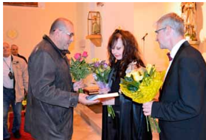
Koncert uspořádala obec Vranovice ve spolupráci s farností