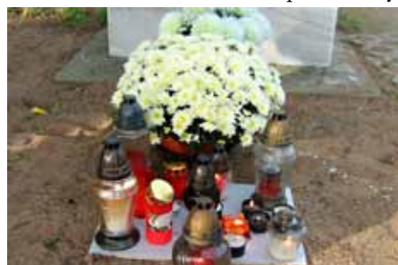
V den Památky zesnulých jsme vzpomněli na své bývalé členy.

Počátkem listopadu si pravidelně připomínáme Památku zesnulých. Také letos jsme se sešli 2. listopadu na místním hřbitově, abychom uctili památku zesnulých členů klubu, zavzpomínali u hrobů a u hlavního kříže zapálili svíčky.