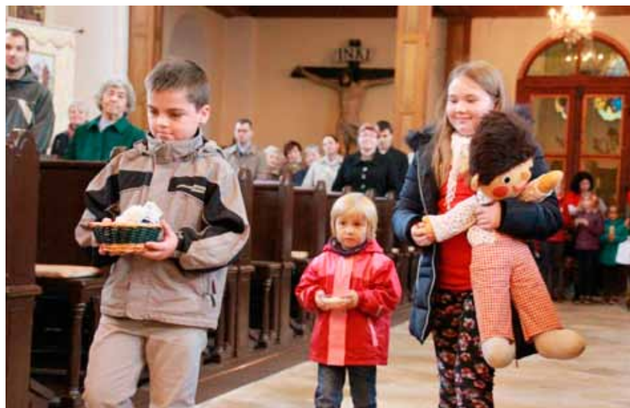
Misijní poslání církve si věřící připomenuli říjnovou bohoslužbou

Výlet zakončila procházka k hradbám a do kapucínské zahrady. Pak už nás čekala jen cesta domů. I přes podzimní počasí si všichni výlet užili.