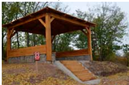
Dominantou parku na kopci bude dřevěný altán

Park o rozloze více než 13 tisíc metrů čtverečních by měl být kompletně hotový do konce listopadu. Obec bude stát zhruba dva miliony korun.