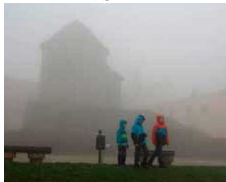
Výhled do údolí Dyje a na rotundu svaté Kateřiny balila mlha

jsme z hradeb viděli alespoň údolí Dyje. Následovala prohlídka kostela svatého Mikuláše, kde nás pustili na kazatelnu.