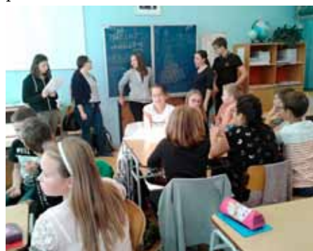
Zábavné aktivity v anglickém jazyce si žáci připravili nejen pro své spolužáky

I v letošním školním roce proběhl na ZŠ Vranovice Den jazyků, a to v pátek 30. září. Tentokrát jej realizovali žáci 7. – 9. ročníků, kteří pod vedením učitelek angličtiny připravili pro své mladší spolužáky (3. – 6. třída) zábavné aktivity v anglickém jazyce. Každá skupina pěti žáků měla na starost jednu vyučovací hodinu a jednu skupinku mladších dětí. Žáci volili nejrozličnější aktivity, od vstupního seznamování, křížovek, doplňovaček, AZ kvízu a her s kartičkami až po hry náročné na koordinaci celé třídy (hry v kruhu se slovní zásobou, „lidské“ pexeso) a hry připravené a realizované pomocí interaktivní tabule.