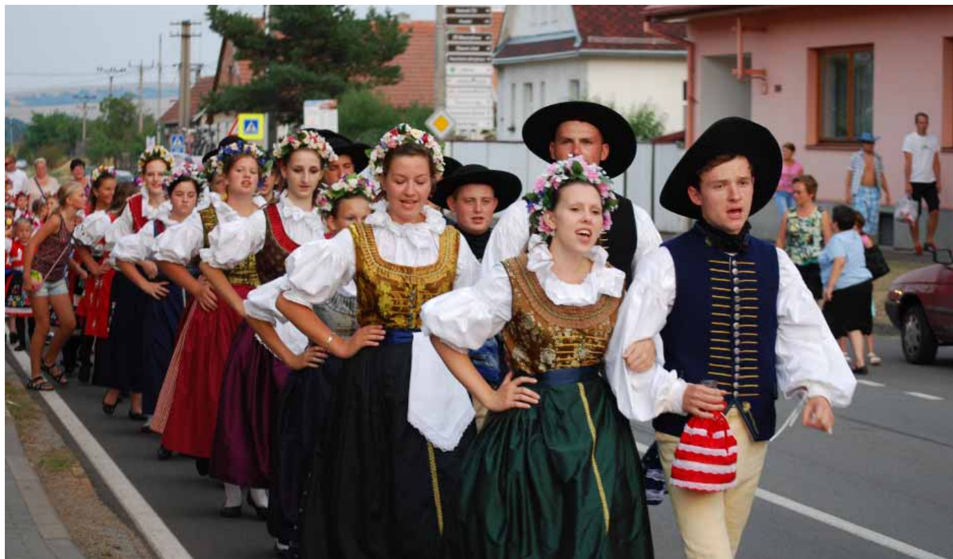
O letošních hodech se stárky a stárci předvedli ve vranovickém kroji už podruhé.