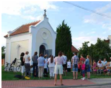
Po dlouhé době ožila kaplička na Ivaňské mši svatou

V pátek 4. září se netradičně sešli děti a rodiče z Vranovic a okolí u kapličky na Ivaňské ulici. Díky péči obce Vranovice byla kaplička, zasvěcená Panně Marii - Matce dobré rady, v loňském roce nově zrestaurována.