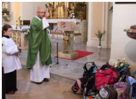
Malí školáci si nechali požehnat aktovky a školní potřeby