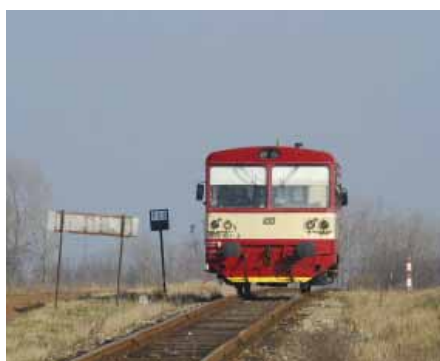
Před sedmi lety projel po trati poslední vlak