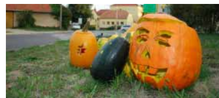
Vranovické dýňování