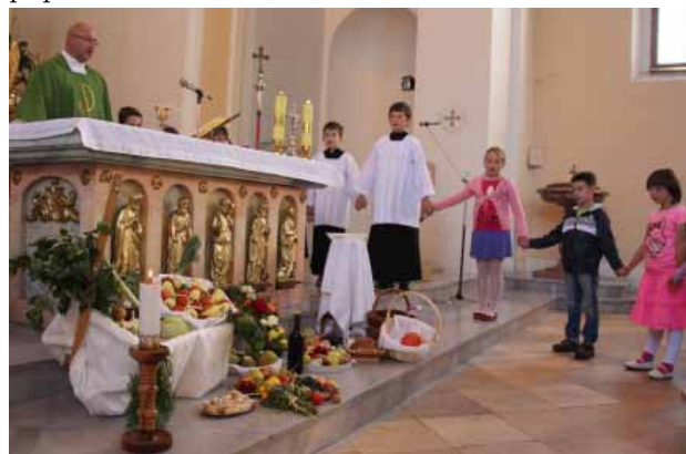
Obřad poděkování za úrodu se uskutečnil poprvé před čtyřmi lety

V neděli 13. září poděkovala naše farnost Pánu Bohu za letošní úrodu. Výzdoba plody z našich zahrádek kolem oltáře, kterou velmi pěkně připravila rodina Machova a Stejskalova, kontrastovala s prázdnými zdmi a chybějícím inventářem kostela, který ochotní farníci uklidili na faru a tak připravili vnitřek kostela na malování.