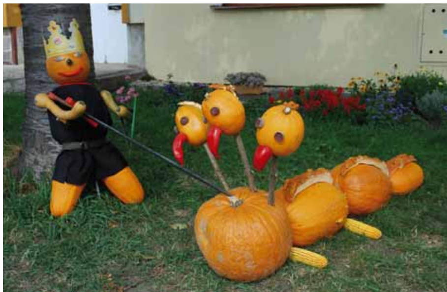
Vítězná sestava – princ bojující s drakem