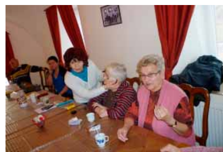
Knihovnice v březnu zavítaly také mezi seniory

Na březnové schůzi 2.3.2015 jsme pozvali mezi nás do klubu p. Ing. Mgr. P. Klabusayovou spolu s p. Papežovou a I. Blechovou. Povídání bylo o novinkách v naší knihovně. Z breclavské knihovny pro nás zapůjčily čtečku knih a MP 3 a seznámily nás s jejich používáním. My starší ale zůstaneme věrni knihám. Knihovna má asi 300 čtenářů, kterým nabízí 8-9 tisíc knih.