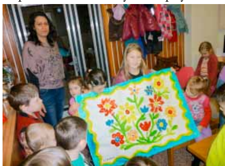
Děti z MŠ darovaly knihovně obrázek s jarní tematikou

Po mnoho let bývá měsíc březen spojován s knihou a čtenářem a v posledních letech také s internetem. Naše knihovna připravila v tomto měsíci pro své čtenáře řadu zajímavých akcí pro různé skupiny svých návštěvníků od dětí až po seniory. Noví čtenáři, kteří přišli v tomto měsíci do knihovny, se mohli zaregistrovat zdarma a pro ty zapomnětlivé platila po celý březen „čtenářská amnestie“ za pozdě vrácené knihy a časopisy.