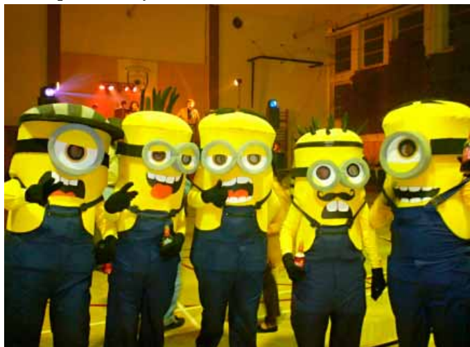
Propracovaná maska se mimonům vyplatila, odnesli si první cenu

Výjimečná byla i promenáda masek. Na place se sešlo přes sto účastníků v přestrojení, což byl rekordní počet. Nechyběli legomani – fotbaloví fanoušci v převleku vranovického „áčka“, Mimoni , biatlonisté , Simpsonovi , missky , mravenci , cyklisté , ani další nápadité masky.