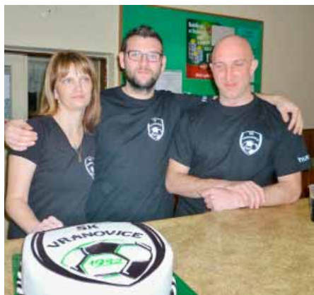
Organizátoři měli z letošní návštěvnosti radost

Dalším rekordním zápisem byl počet všech hostů, který se šplhal až k číslu 270...!! A z tohoto jich celých 110 přišlo v karnevalovém přestrojení, což je další rekord.