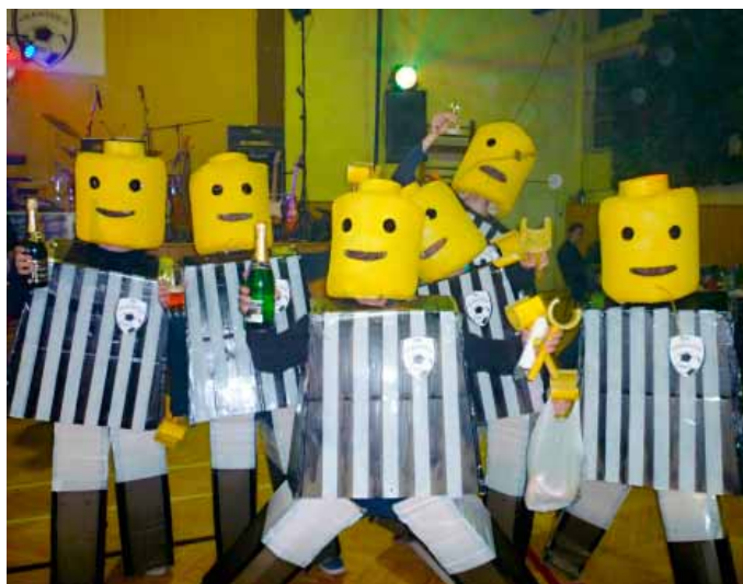
Fanouškovská podpora našeho áčka nezklamala

Oceněno bylo pět nejlepších masek, podle počtu získaných hlasů přítomných návštěvníků. Cenu za nejlepší masku si odnesli Mimoni, kteří v konečném součtu jen těsně porazili lego tým. Na třetím místě se umístili biatlonisté. Jako čtvrtou nejoriginálnější masku návštěvníci zvolili Simpsonovi, štangli salámu a lahev šampaňského si odnesli i mravenci za páté místo.