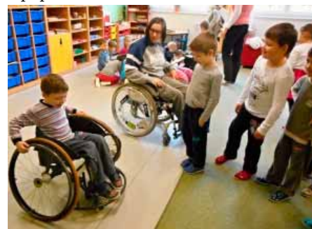
Vozíčkáři přiblížili dětem život s handicapem

Jak nejlépe poznat člověka se zdravotním postižením? Potkat se s ním a popovídat si.