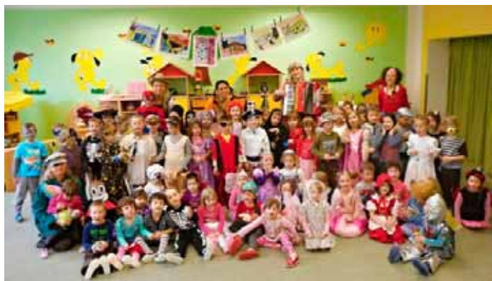
Děti z MŠ si připomněly tradici masopustní veselice