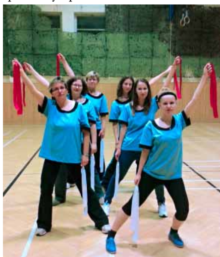
Ženy z vranovického oddílu si na sokolské setkání připravily skladbu „Pro radost“

Stalo se již tradicí, že v období mezi slety připravují Brněnské župy sportovní sokolské setkání pro všechny věkové kategorie - Sokolské Brno, a to v termínu 5.-7.června 2015. Zároveň to bude i oslava 25 let znovuoživení České obce sokolské. Budou předvedeny hromadné stadionové skladby, pódiové skladby. Vzdělávací odbor připravuje pro účastníky kulturní program a různé soutěže. Součástí bude také Olympijský šplh v Olympii.