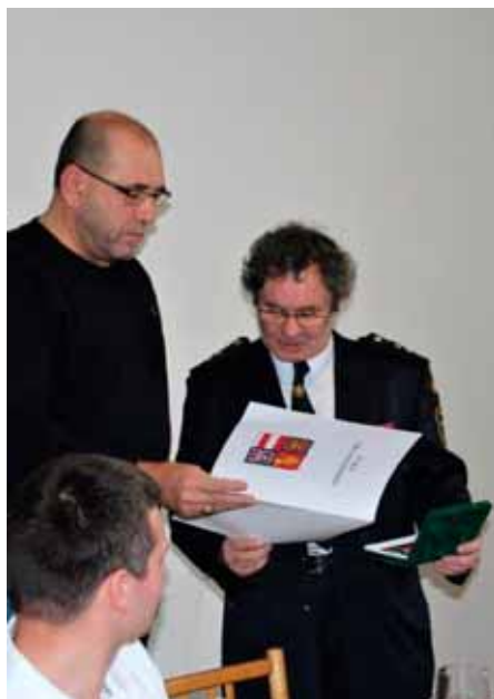
Dlouholetou práci v hasičském sboru ocenil i starosta obce