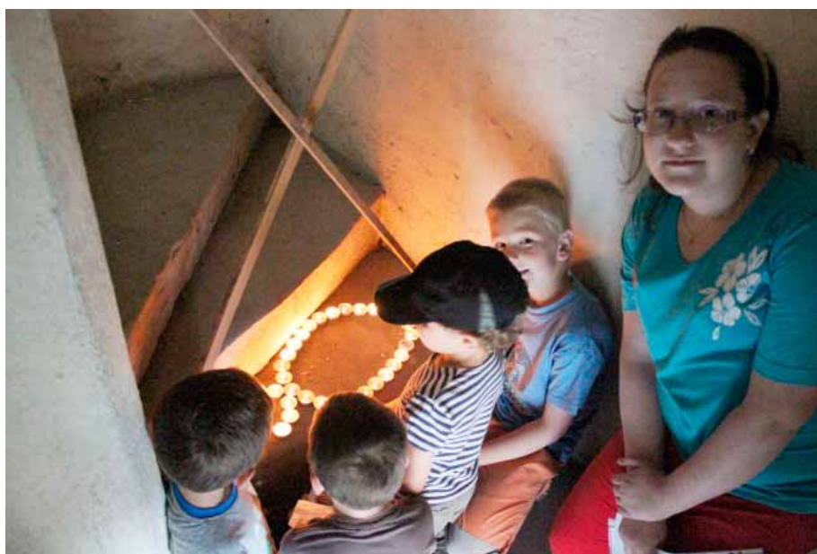
Děti v rámci noci kostelů 2014 vytvořily ze zapálených svíček obrázek.