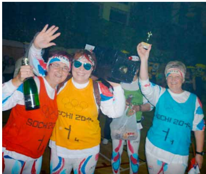
Čeští biatlonisté slavili úspěch i ve Vranovicích

Oceněno bylo pět nejlepších masek, podle počtu získaných hlasů přítomných návštěvníků. Cenu za nejlepší masku si odnesli Mimoni, kteří v konečném součtu jen těsně porazili lego tým. Na třetím místě se umístili biatlonisté. Jako čtvrtou nejoriginálnější masku návštěvníci zvolili Simpsonovi, štangli salámu a lahev šampaňského si odnesli i mravenci za páté místo.