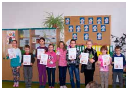
Nejlepší recitátoři prvního stupně ZŠ

Opět po roce se sešli žáci 1. stupně ZŠ na recitační soutěži. Nejprve proběhla třídní kola a tři nejlepší recitátoři z každé třídy soutěžili ve školním kole, které se uskutečnilo 13. února. Osmnáct nejlepších recitátorů přednášelo básničky různých autorů. Všichni se připravili velmi poctivě a porota měla těžký úkol – koho zvolit za vítěze.