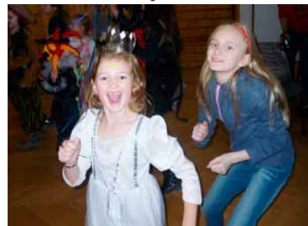
Děti dováděly na parketu

Princezny, kouzelníci, piráti a další pohádkové postavy zaplnili v neděli 22.3. 2015 vranovickou sportovní halu.