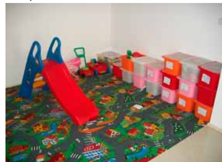
Dětský koutek v Klubu maminek nyní působí upraveným dojmem

Nové vybavení přispělo ke zútulnění společenských prostor v Domě pro seniory, kde se pravidelně schází maminky se svými ratolestmi.