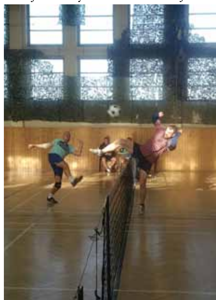
Borci v akci

Oddíl všestrannosti – nohejbal uspořádal dne 17.11.2018 v sokolovně turnaj tříčlenných družstev v nohejbalu.