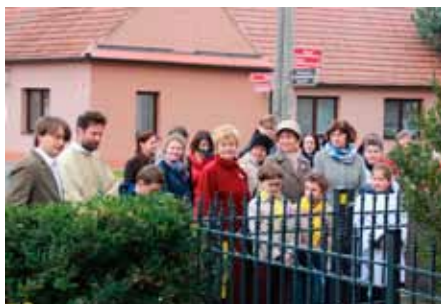
Shromáždění u pomníku

Mši svatou 28. října jsme slavili slavnost zasvěcení kostela a současně svátek 100. let naší republiky. Po mši svaté účastníci bohoslužby šli společně k pomníku za kostelem, zde otec Jaroslav