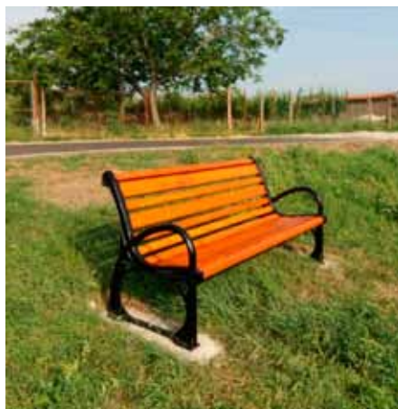
Tak kdepak ji máme?

v centru obce i přilehlém okolí zejména na žádost seniorů, aby měli při svých procházkách příjemná místa k odpočinku. Jednou z nich byla i ta v ulici Vinohrádky. Naším občanům sloužila celé léto. Nyní už by jste lavičku na tomto místě hledali marně. Zbyly po ní jen prázdné díry v betonu. Kam asi obecní lavička zmizela, hodila se snad na něčí zahradu? Zkuste se porozhlédnout. Celková škoda odcizeného obecního majetku přesahuje částku 10 000 Kč.