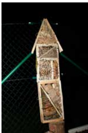
Domeček pro broučky