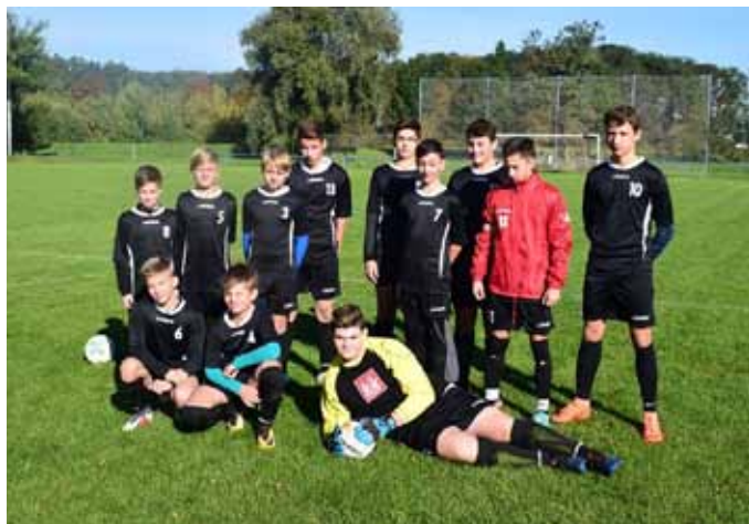
Hráči turnaje O Pohár ZŠ Velké Němčice