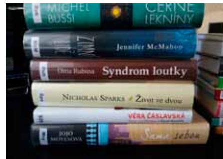
Nové knihy z výměnného fondu Břeclav

Obecní knihovna Vranovice nabízí svým čtenářům 216 nových knižních titulů zapůjčených z VF v Břeclavi. Jedná se zejména o beletrii pro dospělé a pro děti, včetně obměněného fondu literatury naučné.