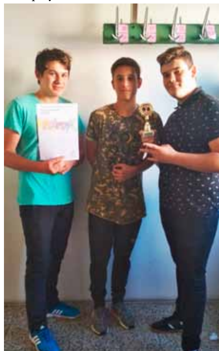
Vranovičtí reprezentanti v ping – pongu

Hned při rozpínávání bylo všem jasné, že pro Vranovice bude znamenat úspěch i pouhý zisk setu. V prvním utkání jsme změřili síly se Zbýšovem. Kluci byli nejprve hodně nervózní, i když postupem času ze sebe nervozitu setřáslí, na soupeře jednoduše neměli a padli jednoznačně 0:4 na zápasy.