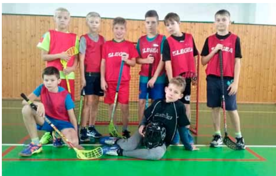
Florbalové mužstvo Vranovic

Následně se na hřišti odehrával vyrovnaný souboj. My jsme byli jistější