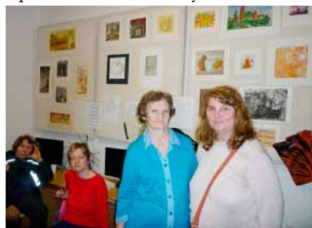
Výstava potrvá až do 9. ledna 2015

Výstava byla zahájena vernisáží v pátek 7. listopadu 2014 a měla velký úspěch. Ti kteří nestihli přijít, nemusí zoufat, mají totiž možnost výstavu navštívit až do 9. ledna 2015. Otevřeno je v provozní době knihovny.