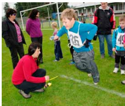
Hlavními disciplínami byl běh, hod míčkem a skok z místa.

Soutěžilo celkem 24 dívek a 31 chlapců. Při příchodu na hřiště dostaly děti startovní číslo a kartičku k zapsání výsledků. Zahájení závodů bylo v 16 hodin, kdy závodníci nastoupili a byli seznámeni s jednotlivými stanovišti. Poté se děti pod vedením Renaty Karpíškové rozcvičily, protáhly a nachystaly k samotnému soutěžení.