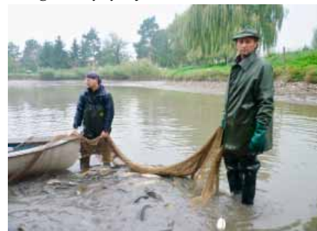
Výlovy se zdařily, ryba se vysazovala v dobré zdravotní kondici

Týden předtím se zatahoval rybník. Výsledkem bylo 1350 kg kaprů, 143 kg amurů, 10 kg línů, 16 štik, 5 candátů, 10 kg bílé ryby a jeden sumec.