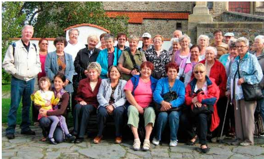
Společné foto na Bouzově