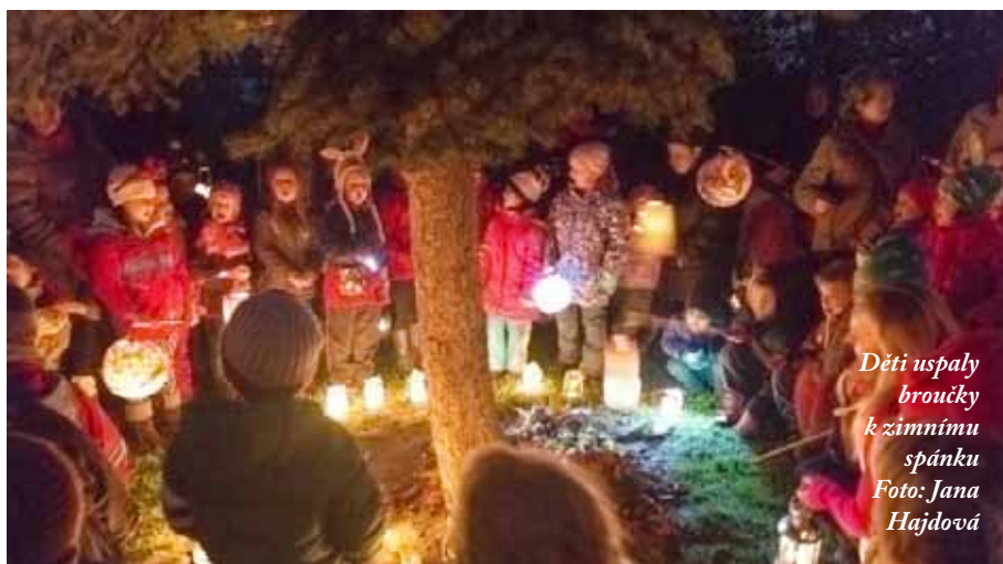
Děti uspaly broučky k zimnímu spánku

Děti, rodiče, prarodiče, paní učitelky a zvířátka se sešli před školkou ve velice hojném počtu, aby se vydali za doprovodu více, či méně kouzelných