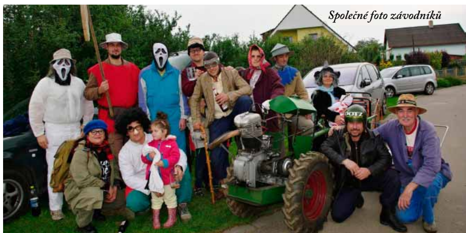
Společné foto závodníků