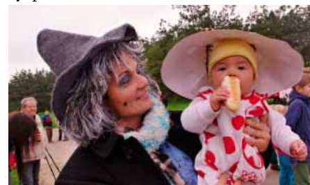
Nejmladší účastníci byla Verunka alias muchomůrka.

Zvuk traktůrků a fréz se rozléhal Vranovicemi v sobotu 4. října. Vranovický Hlinek zaplnili závodníci v maskách. Na startu nechyběla závodnická čísla s názvem Hospoda, Babka s dědkem Saroléa, do jedné z fréz zasedli strašidelní Vřískoti, závodili také Husité nebo Turisté. Nejmladší účastníci byla muchomůrka Vendulka, která měla připraveno speciální vozítko – peřinami vycpanou káru.