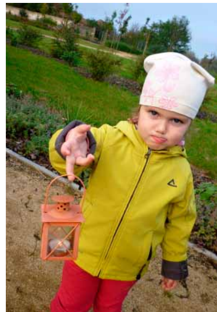
Se světýlky v rukách se děti vydaly vstříc dobrodružství