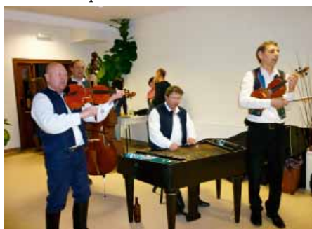
Atmosféru zpestřil cimbál

Již pošesté se sešli milovníci dobrého vína, aby ochutnali archivní vína od vinařů z Vranovic a okolí. Konala se tradiční a velmi oblíbená Výstava archivních vín. Tu každoročně pořádá místní sdružení vinařů a oblíbenost této akce každým rokem stoupá.