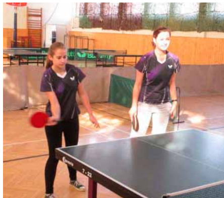
Čtyřhra Dvořáčková, Veselá

Domácí hráčky přivítaly svoje soupeřky z Bošovic, Břeclavi, Dubňan a Řeznovic. I přes skutečnost, že vranovickým juniorkám patří po 4 kolech