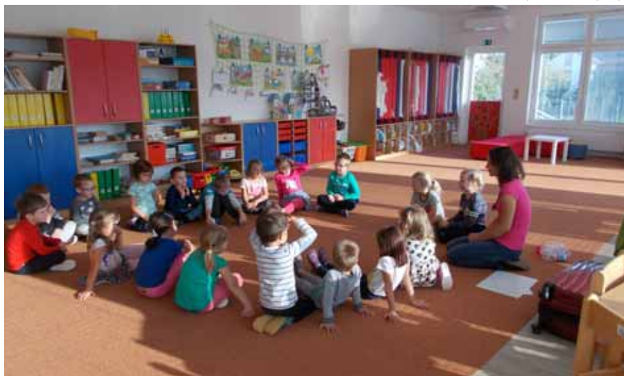
Povídání o vodě