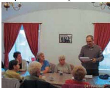
Povídání o změnách ve vlakové dopravě

řád v rámci celé republiky. Nás se týkají hlavně změny v rámci jihomoravského kraje, který je objednavatelem regionální dopravy. Rozsah vlakové dopravy na území kraje bude více či méně stejný jako loni. Jen část vlaků, které končily nebo začínaly ve Vranovicích, bude odkloněna v Hrušovanech u Brna na obnovenou trať do Židlochovic. A to v době od 7 hodin do 14 hodin. Týká se 6 vlaků z a do Brna. V té době pojedou jen v H:10 z Brna a H:18 do Brna. K lékaři a do práce bude nutno odjíždět dříve.