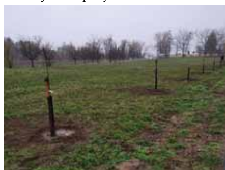
Ovocná alej na Přibice

Na celém světě probíhá mnoho projektů na podporu vysazování stromů. Osazovat krajinu stromy je velmi důležité. Stromy přispívají k čistšímu prostředí, vstřebávají oxid uhličitý, ochlazují přilehlé okolí, pomáhají zadržovat vodu v krajině a snižují erozi půdy.