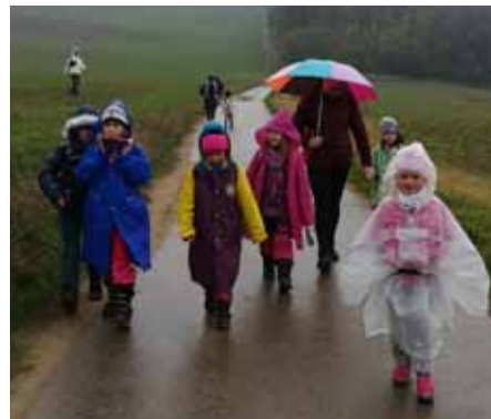
Trocha toho deštíku nás nerozhází