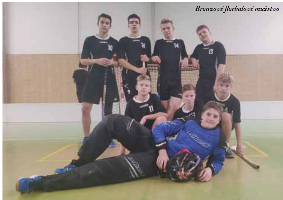
Bronzové florbalové mužstvo

trochu jinak byl závěr zápasu. Vysílený soupeř už neměl morál a my celkem v poklidu došli k výhře.