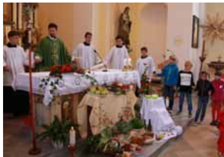
Poděkování za úrodu