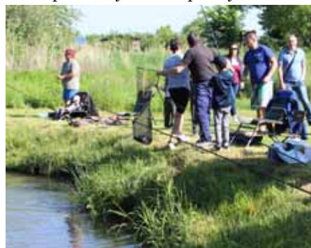
Jedna ryba za druhou