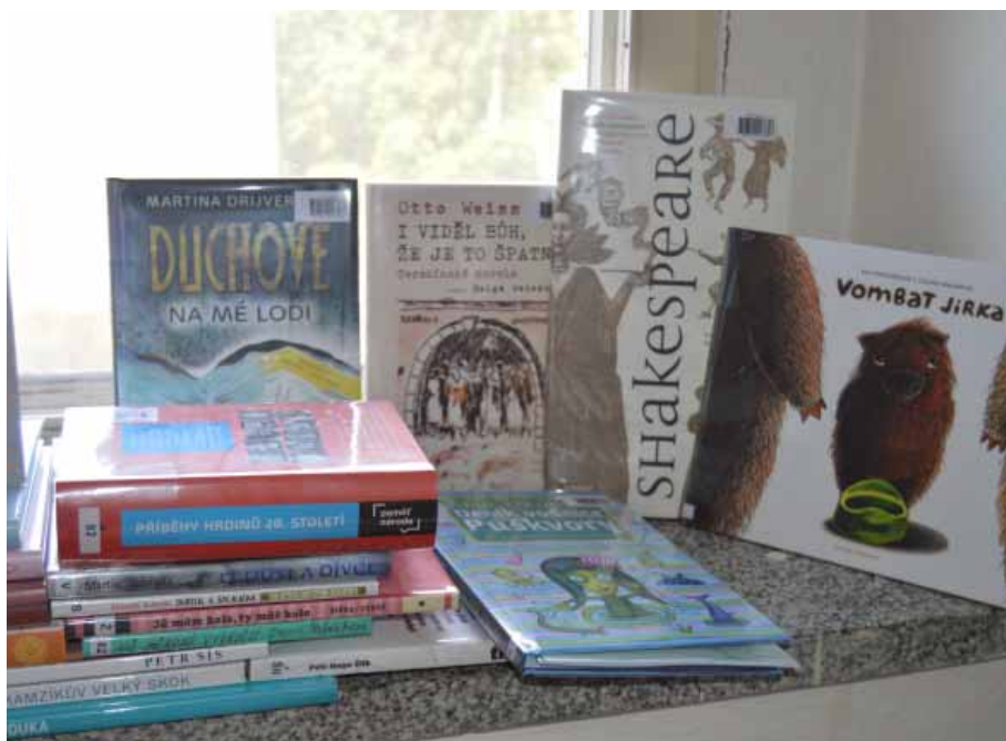
Nové knihy v knihovně.

Při probíhající regeneraci stávajícího knižního fondu došlo během prázdninových měsíců k vyřazení 309 poškozených, neaktuálních a čtenáři nevyužívaných titulů. Tyto vyřazené knihy budou od měsíce října základem pro tzv. „Knižní tržiště aneb přines knihu, odnes knihu“ - akci probíhající v rámci