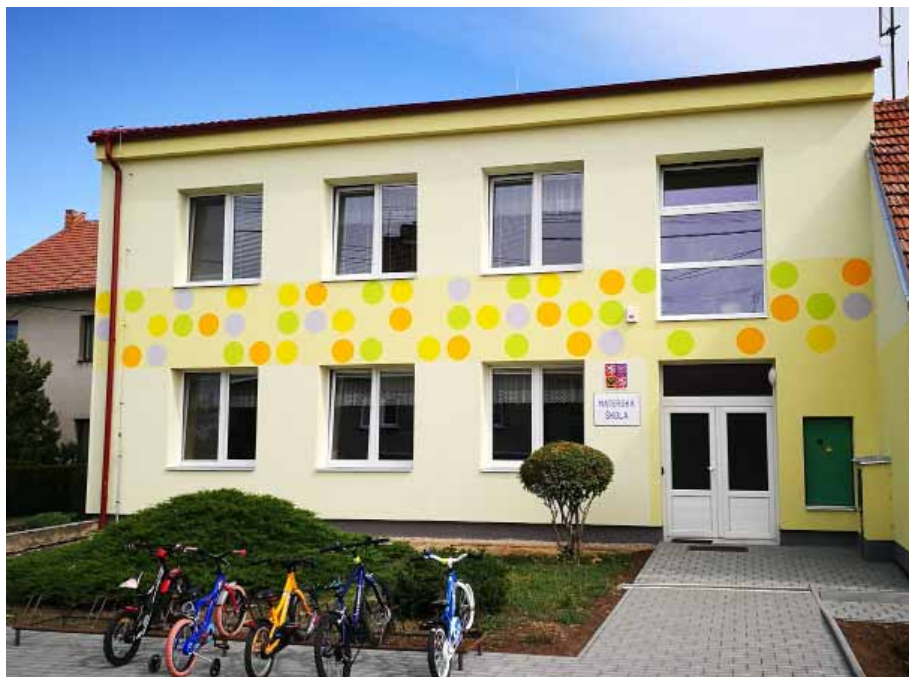
Nová fasáda mateřské školy

přední části budovy, kde vznikne školní družina, knihovna a Základní umělecká škola. Druhá etapa si vyžádá investici téměř 25 milionů korun. Jedná se o největší investici do rozvoje vzdělávání, za posledních několik desítek let.