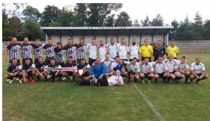
Oslava 85.výročí SK Vranovice