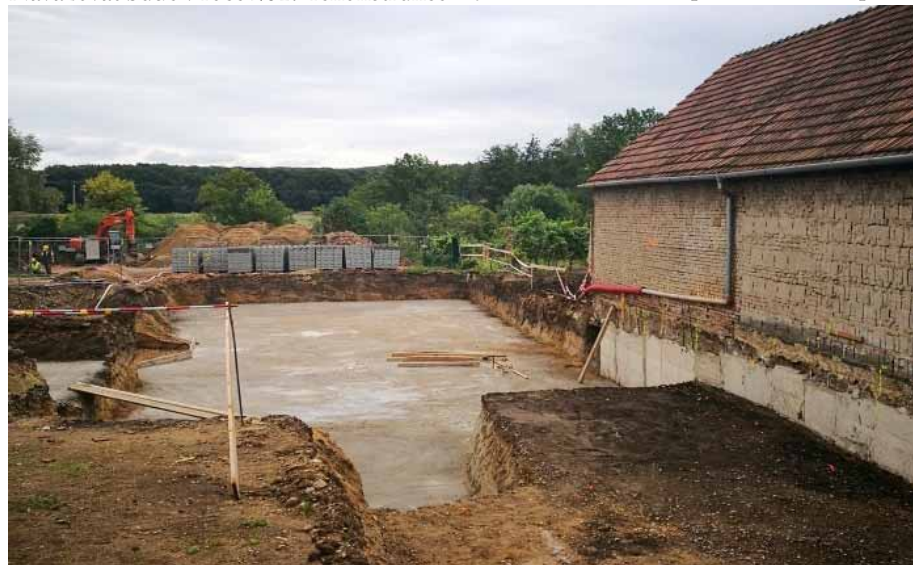
Základy v dvorním traktu budovy U Floriánka

První etapa rekonstrukce bude završena v srpnu 2018 a její náklady budou přibližně 45 milionů korun bez daně. Navazovat bude v roce 2019 rekonstrukce