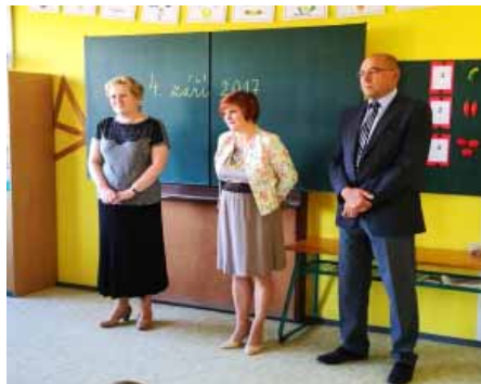
Zahájení školního roku v 1.A