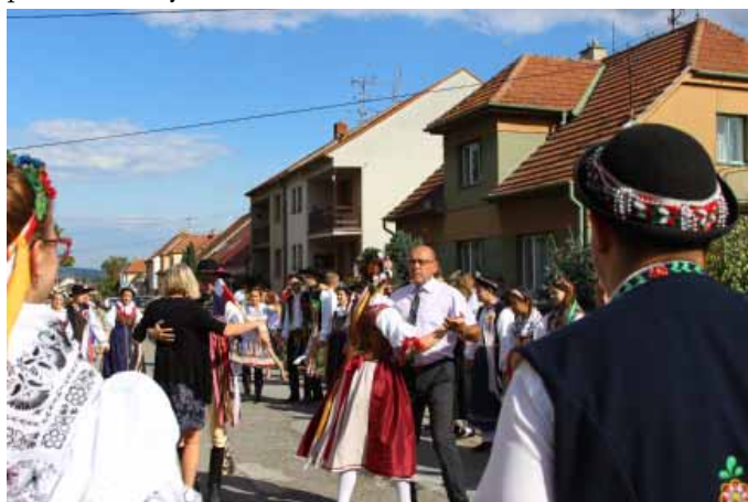
Sólo s panem starostou

Ale nepředbíhejme. Třetí srpnový víkend patří ve Vranovicích tradičně hodovému veselí. Ani letošní rok nebyl výjimkou a v termínu 19. - 21. srpna se u nás konaly Tradiční vranovické hody. Letošní organizace se spolu s krojovanou chasou ujali vranovičtí Vinaři. A že jde o přípravy opravdu náročné dokazuje i to, že dříve než si mohli stárce zajuchat pod nazdobenou májou, museli 18 metrů dlouhý strom dopravit ze sousední obce a v pátek odpoledne ji za pomoci mnoha silných paží ze vsi vztýčit na hřišti za Sokolovnou.