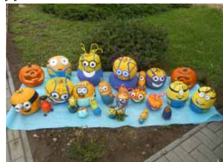
Mimoně z dýní

hodinách samostatně v domácím prostředí vytvářeli vlastní Mimoně dle jejich fantazie.