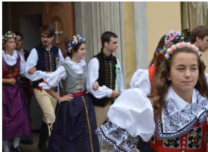
Po hodové mši