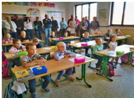
První školní den v 1.B