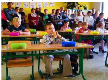
První školní den v 1.A

Budova Základní školy U Floriánka se 4. září před osmou hodinou ranní začala zaplňovat novými prvňáčky, které na jejich první cestě do školy většinou doprovázeli jejich rodiče a prarodiče. Většina dětí byla z nového prostředí nejistá, ale zároveň plná očekávání z nadcházejících školních povinností, a mnozí rodiče nedokázali skrýt své dojetí.