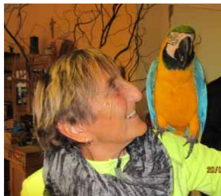
Přítulný papoušek Ara

Při výkladu, jak svíčky zdobit, nám zaměstnanci připravili kávu a koláče.