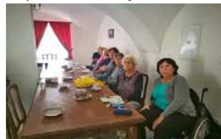
Zahajovací setkání v Klubu seniorů

V úterý 12. 9. 2017 se v Klubu seniorů sešlo na pilotní schůzce prvních 15 potenciálních zájemců o Virtuální univerzitu třetího věku, která zahájí 5. října ve Vranovicích svůj první semestr. Senioři se při setkání seznámili s výhodami Virtuální univerzity. Největší předností je snadná dostupnost v místě bydliště a široký výběr kurzů, které je možné studovat. Pro následující zimní semestr vybrali senioři téma Potraviny a spotřebitel. Shodli se, že se jedná o zajímavou a aktuální problematiku.