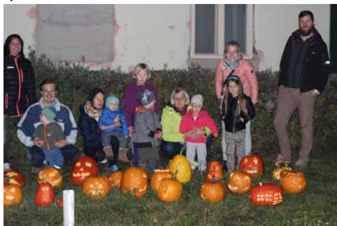
Slavnostní zapálení dýní