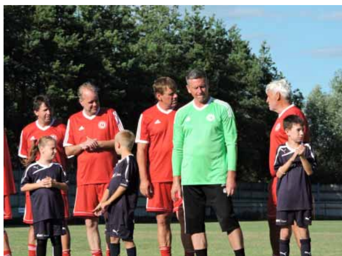
Oslava 85.výročí SK Vranovice