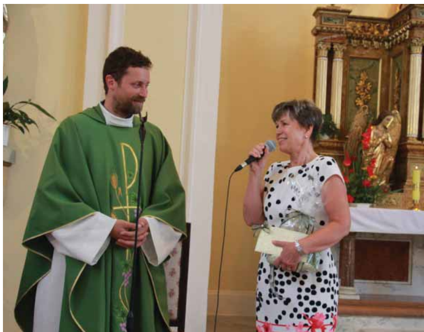
Blahopřání od farníků.