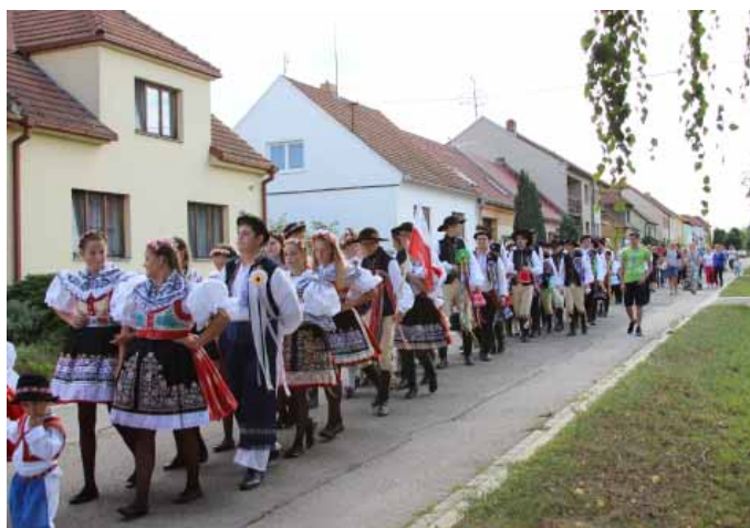
Průvod stárků obcí