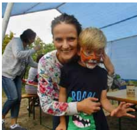
Dívčák tygřík v Hlinku