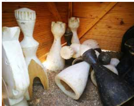
Zničené šachové figurky

vzhledu se totiž výrazně podepisují vandalové. A nejedná se jen o nezralé pubescenty, pro které je podobné chování častým projevem období vzdoru. V Hlinku můžeme při ničení mobiliáře spatřit i menší děti.