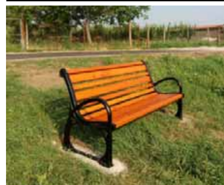
Nové lavičky v obci

Na podnět seniorů pořídila obec 10 nových parkových laviček, které byly v minulém týdnu instalovány v centru