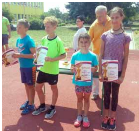
Vítězové atletického trojboje

Na to, že žáci naší školy nemají kde plnohodnotně atletické disciplíny trénovat (někdo skákal v Rajhradě poprvé v životě do písku), tak vranovičtí atleti předvedli perfektní výkony, za které jim náleží zasloužená pochvala!