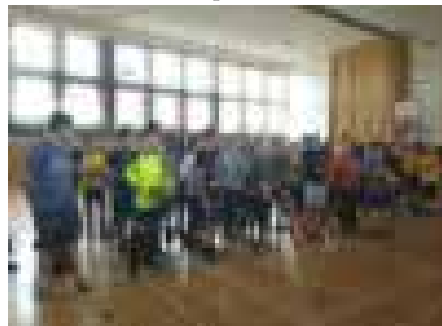
Deváťáci na sportovním odpoledni

Rozloučili se stylově. Suverénně nejúspěšnějšími žáky sportovního dopoledne, které tradičně završuje školní rok, se stali žáci deváté třídy. V úterý 26. června nejstarší studenti opanovali jak turnaj v přehazované, tak i florbalové klání. Při obou disciplínách se však na triumf hodně zapotili.