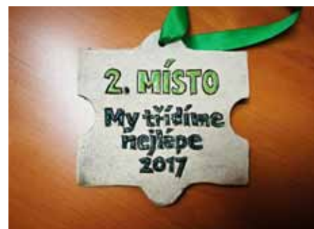
Ocenění Vranovic za třídění odpadu