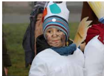
Tríkrálová sbírka 2018

Sledujte aktuální dění v obci na www.vranovice.eu Facebook Vranovice Obec