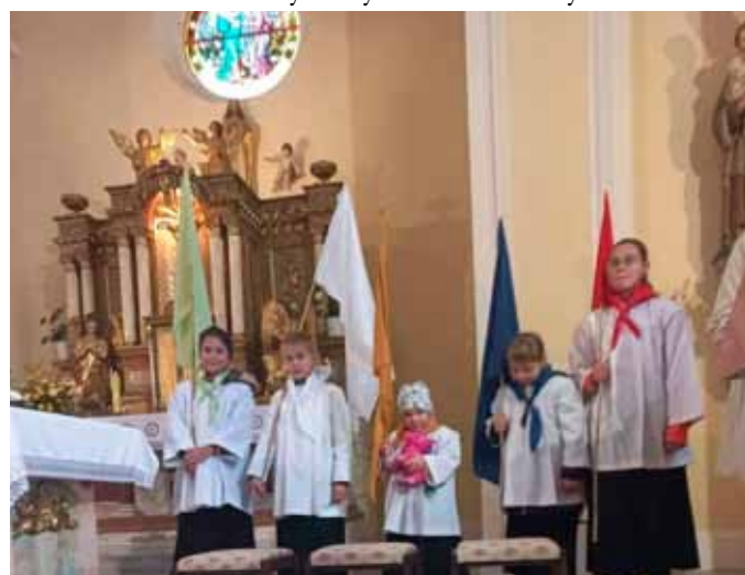
Vranovická děvčata na misijní neděli.

V neděli 23.10. 2022 se dívky z naší farnosti probudily do podzimního rána a nedočkavě se připravovaly na mši svatou věnovanou misiím. Čekal na ně čestný úkol. Bílé ministrantské oblečení každé z nich doplňoval barevný šátek a vlajka představující jednotlivé kontinenty našeho světa. Zelená barva pralesů náleží Africe, žlutá připomíná svítání na východě a představuje Asii, pro Evropu je příznačná bílá, modrá barva oceánů symbolizuje ostrovy Oceánie a Austrálie. Poslední červená náleží domorodým obyvatelům Ameriky.