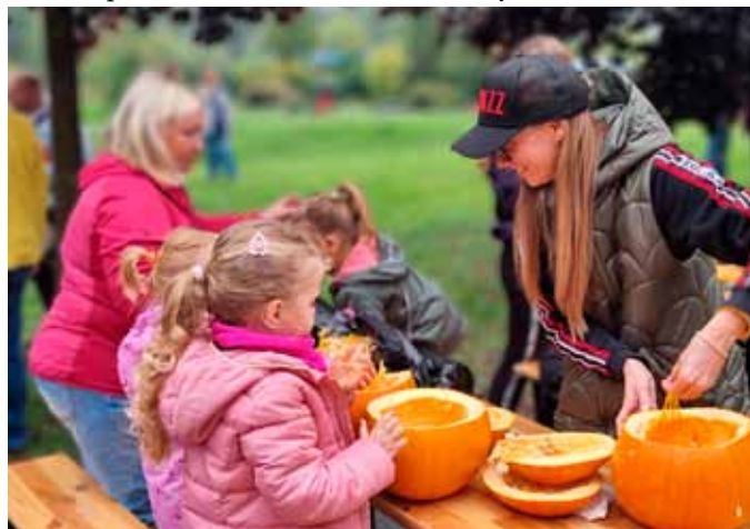
Dětem pomáhali s vydlabáváním dýní i jejich rodiče

V sobotu 8. října proběhla v parku za Domem pro seniory tradiční podzimní událost – Vranovické dýňování.