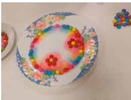
Umělecká díla z lentilek

My však milujeme LENTILKY, nejen pro tu chutnou čokoládu, ale i pro jejich barevnost. Víte, že lentilky můžou být i zdrojem uměleckého díla? My jsme to také netušili, ale rádi jsme pokus s lentilkami vyzkoušeli. Moc nás to všechny bavilo. To, co lentilky pomocí teplé vody vytvořily, byla opravdu umělecká díla.