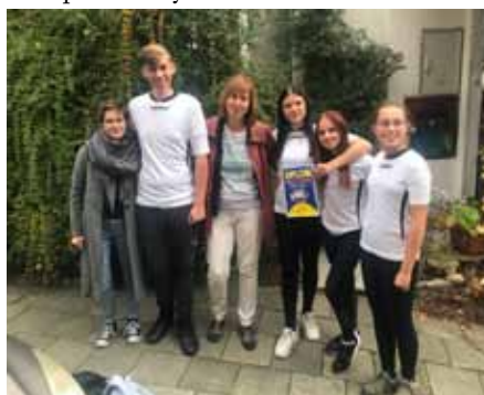
Vítězný kolektiv žáků 8.A

Školní tým třídy 8. A získal v konkurenci dalších škol z okolí Pohořelic zaslouženě 1. místo v soutěži „Bezpečně v kybersvětě“.