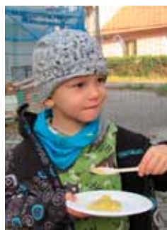
I děti ochutnaly kaši školáků ze Zambie a Malawi

„Zajistit dětem v nejchudších oblastech světa jedno teplé jídlo denně v místě jejich vzdělávání a tak přivést hladovějící děti do školních tříd, kde získají vědomosti, které jim v budoucnu mohou pomoci vymanit se z chudoby.“