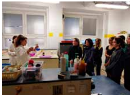
Žáci 9. A sledují barevné chemické pokusy

SPŠCH Brno bude v příštím roce otvírat dva první ročníky oborů Aplikovaná chemie (zaměření analytická chemie, zaměření farmaceutické substance a zaměření ochrana životního prostředí), konkrétní zaměření oboru Aplikovaná chemie si žáci zvolí na konci 1. pololetí prvního ročníku studia. Dále se bude otvírat po jedné třídě oboru Analýza potravin a Přírodovědné lyceum.