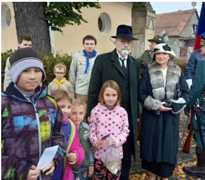
Vranovické děti se vyfotily s prezidentským párem

V pátek 28. října 2022 zažili obyvatelé z Vranovic a okolních obcí netradiční připomínku 104. výročí vzniku Československa. Vranovice v pravé poledne navštívil „osobně“ první československý prezident Tomáš Garrigue Masaryk, resp. jeho dvojník. Vzpomínková akce byla kulturně-historickou připomínkou skutečnosti, kdy náš region byl jedním z míst, které si vybral T. G. Masaryk pro trávení své letní dovolené.