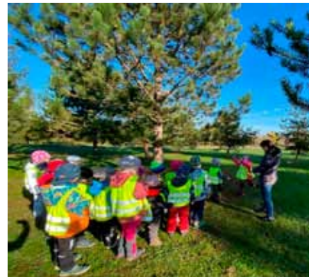
Zastavení pod velkým dubem

slavil v roce 1906, světové války a následně komunistický režim však tuto tradici přerušili. V naší zemi byla tato tradice obnovena v roce 2000, datum oslavy svátku stromů bylo stanoveno na 20. října.