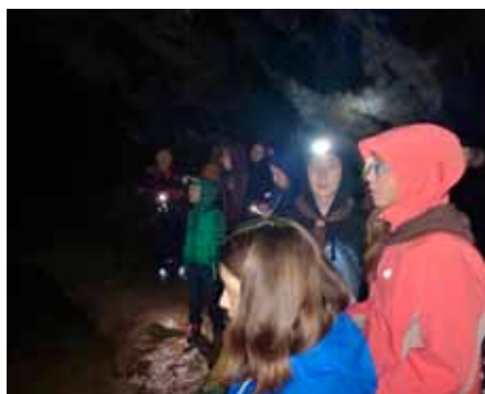
Návštěva jeskyně Býčí skála

V pátek 23. 9. jsme se společně vydali na výpravu do Křtin. Po pohodové cestě jsme se ubytovali ve skautské klubovně hned vedle kostela a celý večer jsme započali večerí. Následoval volnější program v podobě společenských her. Ráno jsme se hned po snídani vydali na cestu k Býčí skále, kde jsme měli domluvenou soukromou prohlídku. Šli jsme pouze s vlastními baterkami a záhy jsme zjistili, že naše vybavení mohlo být o drobet lepší. První půlka jeskyně byla bezproblémová. V druhé půlce jsme museli překonávat jednu velkou překážku v podobě Křtinského potoka.