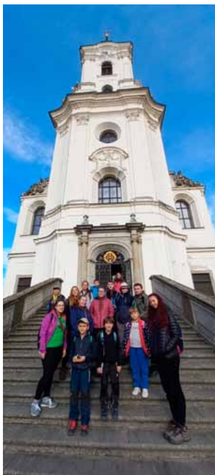
Fotka před křtinským kostelem nesmí chybět