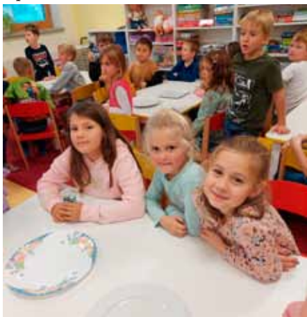
Den čokolády ve školní družině

V pátek 4. listopadu se všechna oddělení školní družiny sešla na Floriánku. Oslavili jsme společně Den čokolády. Paní vychovatelka nám řekla tolik zajímavostí o tom, jak vlastně čokoláda vzniká. Která je nejchutnější a proč.