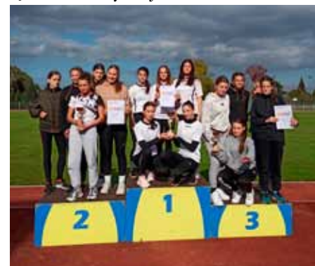
Úspěšné družstvo naší školy

19. října se v Břeclavi na atletickém stadionu konalo krajské kolo Atletického čtyřboje. Naše dívky si po vítězství v kole okresním vyslápaly i na soupeřky v kraji a z prvního místa postupují na republikové finále! To se skutečně příští rok v dubnu v Opavě, nebo v Břeclavi. Žákyně tam budou reprezentovat nejen naši školu, ale i Jihomoravský kraj.