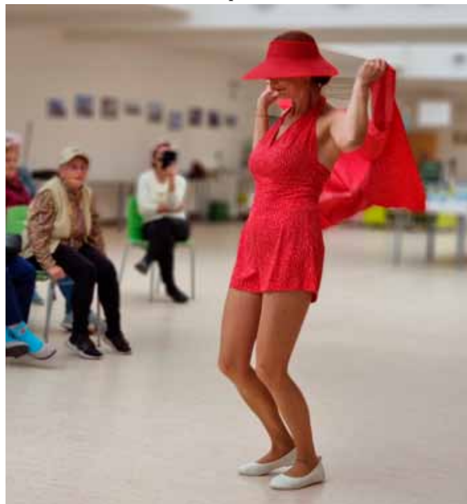
Klobouk jako módní doplněk k plavkám

Den seniorů je svátek, na který obec pravidelně připravuje pro seniory z vranovického Klubu seniorů kulturní program s občerstvením. V letošním roce byl pozván Dámský kloboukový klub Dantes s módní přehlídkou klobouků a kostýmů mapující dámskou módu od historie až po současnost.