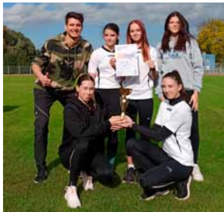
Vítězky atletického čtyřboje