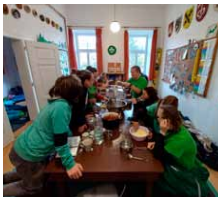
Nocleh se stravou ve skautské klubovně

Všichni však byli velmi stateční a šikovni, a tak jsme se i navzdory horším podmínkám dostali ve zdraví ven. Poté