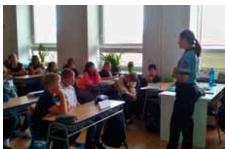
Žáci 6. třídy si poslechlí přednášku o kyberšikaně