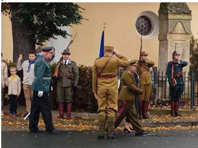
Součástí konvoje byli i členové klubu policejní historie Brno

Podle serveru Kudy z nudy T. G. Masaryk navštívil mezi léty 1924 až 1933 celkem šestkrát zámek v Židlochovicích. Pan prezident přijížděl většinou na tři týdny až jeden měsíc, někdy v doprovodu dcery Alice nebo syna Jana, jindy i s vnuky. Podobně jako na zámku v Kolodějích i tady často jezdil po okolí na svém koni Hektorovi.