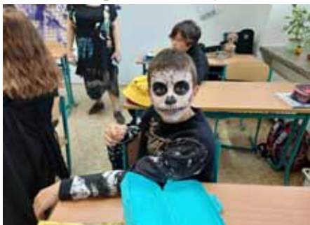
Kostlívce v 7.B

Poslední říjnový den u nás na škole vládla strašidelná atmosféra. Oslavili jsme společně jeden ze světově nejoblíbenějších svátků vůbec – Halloween. K tomuto svátku neodmyslitelně patří kostýmy, vyprávění děsivých příběhů, Trick or Treating („Koledu, nebo vám něco provedu!“) a skvělá zábava. Halloweenský den se letos opravdu velice vydařil.