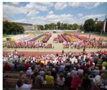
Sokolské slavnosti Brno - nástup

Ve dnech 11. - 12.6.2022 se ve venkovním areálu Sokola Brno I. konala přehlídka 16 hromadných skladeb pro veřejnost (z toho jedna skladba pro ženy byla z důvodu vysokého zájmu cvičenek předvedena dvakrát). Skladbu Čo bude bude, předvedly cvičenky ze Slovenska.