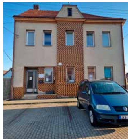
Místa před bývalou knihovnou budou vyhrazena pro návštěvníky zdravotního střediska.