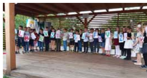
Pasování na čtenáře