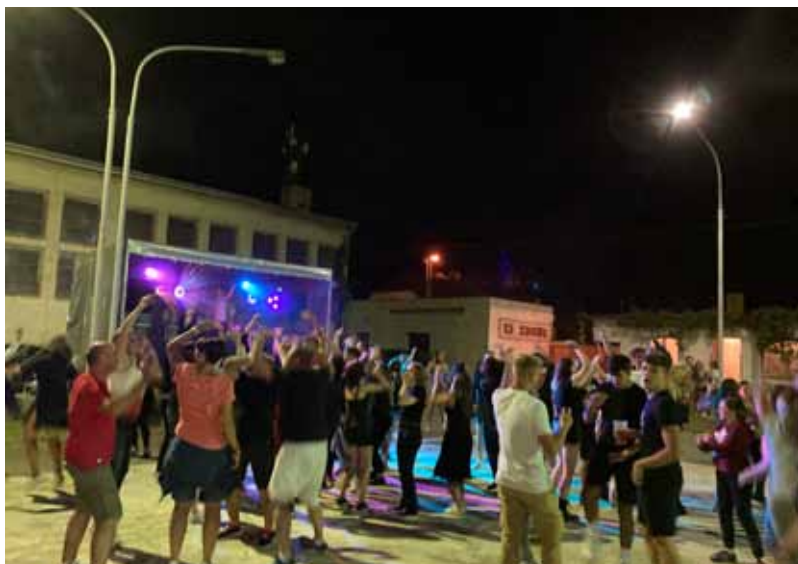
Na parketě to žilo celou noc