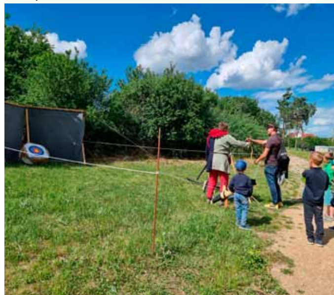
Děti si mohly zastrílet z luku a kuše

„Mami, mami a v Japonsku nám dávali ochutnat sushi,“ ozývaly se takové a další nadšené proklamace dětí nad prožitými zážitky.