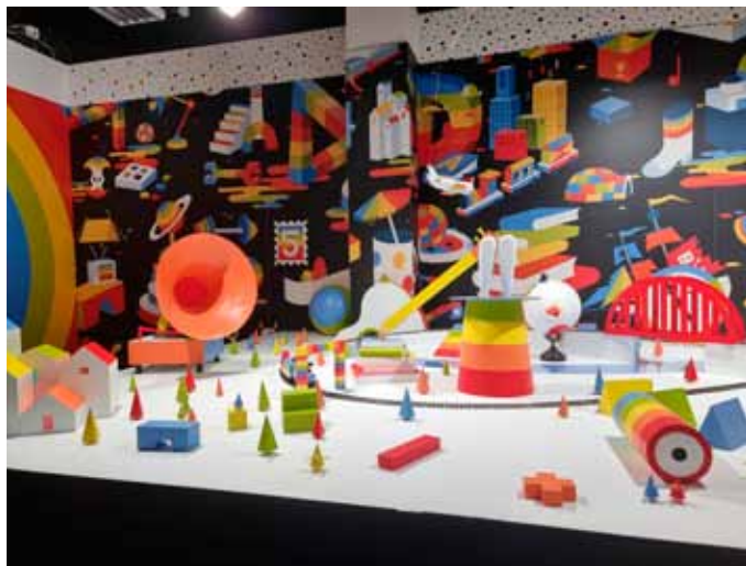
Děti bavil Děčkosvět

Individuální volno po představení si řada rodin zpestřila návštěvou Hamleys , nejstaršího hračkářství na světě, které otevřelo svoji pobočku i v Praze a kam děti při odchodu z divadla dostaly pozvánku formou volné vstupenky na jízdu na Benátském kolotoči.