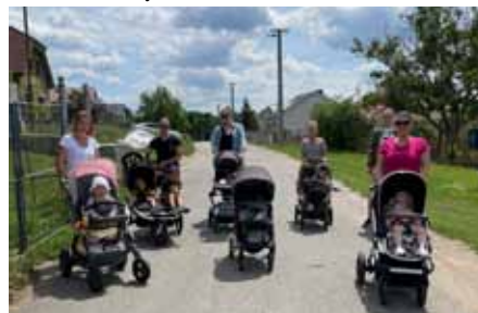
Výlet do Přibic

Stejně tak si všichni užívají setkání, která jsou spojená s nápady na zajímavé pomazánky, pokrmy z vajíček nebo domácí sirupy. Úplně nejoblíbenější částí je ale samozřejmě ochutnávka toho, co kdo doma vytvořil.