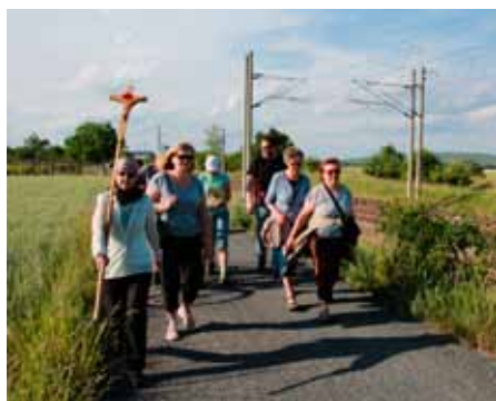
Minipout' ze Žabčic

V úterý 31. května na svátek Navštívení Panny Marie a patrociniem Vranovického kostela proběhla pěší minipout' ze Žabčic do našeho farního kostela ve Vranovicích. Na místo začátku pouti do Žabčic část poutníků dojela vlakem a část na kole. Při cestě podél trati se pak přidávali další poutníci, kteří nemohli z časových důvodů absolvovat celou cestu. Po příchodu do Vranovic vyvrcholila pout' mší svatou ve vranovickém farním kostele v 19 hodin.