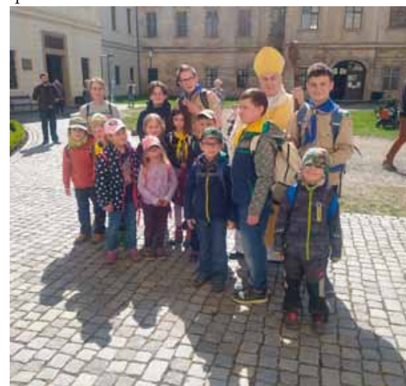
Vranovičtí skauti s odstupujícím biskupem v Rajhradě