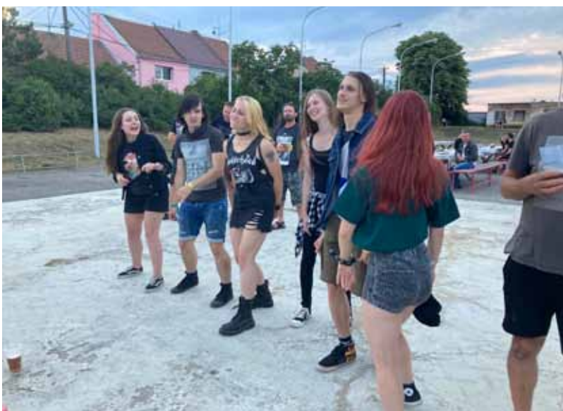
U rockových kapel se bavili mladí i starší ročníky