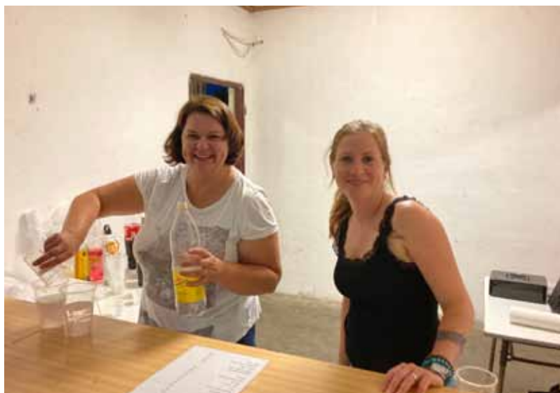
Občerstvení bylo s usměvavou obsluhou