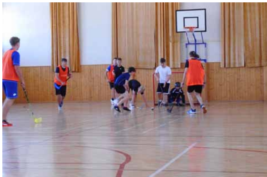
Florbalisté se pořádně zapotili