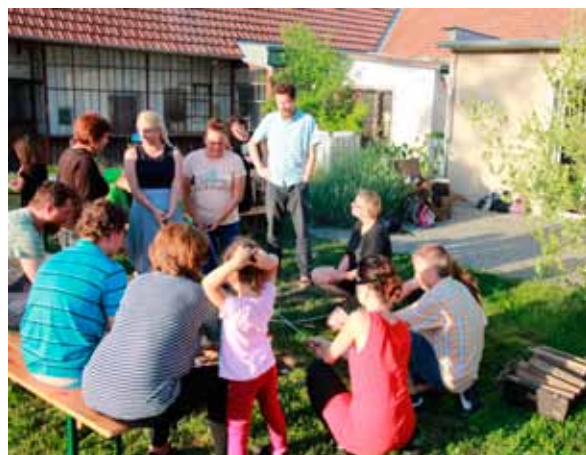
Opékání špekáčků na fáře

Poslední důležitou věcí, kterou bychom chtěli v tomto čísle zpravodaje zmínit, je změna našeho diecézního