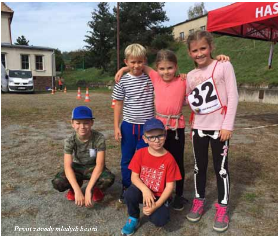
První závody mladých hasičů