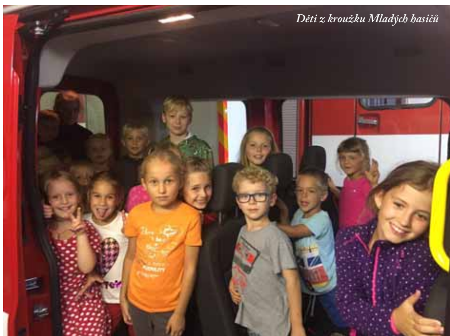
Děti z kroužku Mladých hasičů

Děti zvládly trať dlouhou 2 kilometry v čase 43:27 a umístily se na krásném 22. místě.