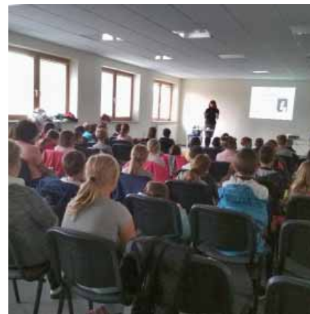
Dopolední školní přednáška

pro veřejnost Partnerské osudy v 19. století. Bohužel současná situace se podepsala i do účasti na této přednášce, ale i tak měla velký úspěch. Jak říká sama autorka „Nevadí, když přijdou třeba i jen dva posluchači, ale odměnou je jejich zájem o dané téma.“