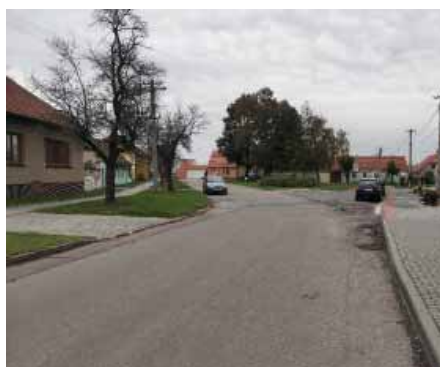
Ulici U Floriánka čeká rekonstrukce