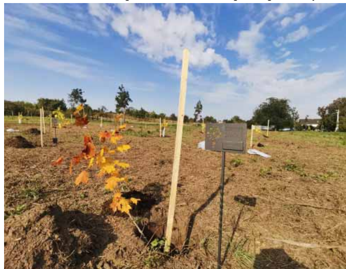
Stromy života 2020

V sobotu 10. října 2020 byly v parku Hlinek vysazeny stromy pro nově narozené vranovické děti nazvané Stromy života. Část výsadby byla z odloženého jarního termínu, který se neuskutečnil z důvodu vyhlášeného nouzového stavu. Ovšem i tento stávající termín byl poznamenán současnou epidemiologickou situací, a tak se mohl odehrát pouze v omezeném počtu přítomných.