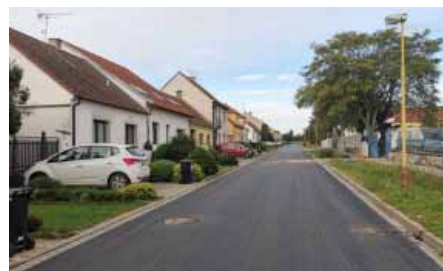
Průjezd Přibickou je už hladký.

Rekonstrukce ulice Přibické je u konce. V druhém říjnovém týdnu byla celá ulice opět zprůjezdněna. Modernizace vozovky, při které byl odfrézován starý asfalt, přidán ochranný nátěr a následně položen nový povrch,