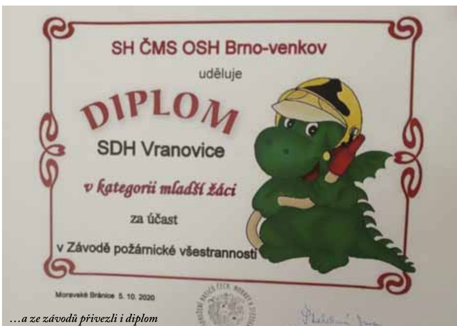
...a ze závodů přivezli i diplom

18.9. 12:49 - požár skládky u hájku 11.11. 19:17 – požár komínu v Přibicích