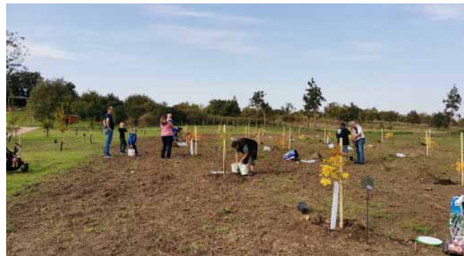
Výsadbu poznamenala epidemiologická situace

Pracovníci obce za pomoci několika rodičů zasadili celkem 31 stromů pro děti narozené v rozmezí od dubna 2019 do června 2020. Po výsadbě habrů, které se vysazovaly v minulých dvou letech se tentokrát osadily javory. U každého stromu je cedulka se jménem dítěte a datem jeho narození.