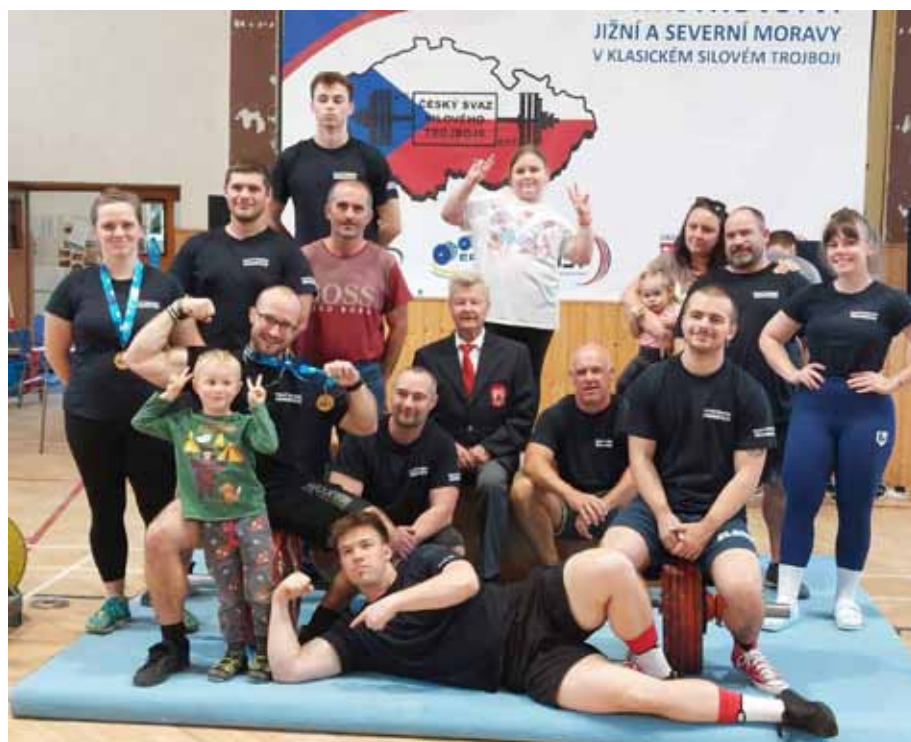
Oddíl silového trojboje pod vedením p. Karpíška