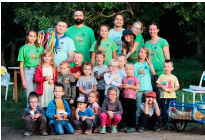
To jsme my

Mezitím na Myslivně ve Vranovicích vyrazil Willy Fog s Benjamínky a mladšími vlčaty a světluškami na pětidenní cestu kolem světa na Příměšťáku 2022. Benjamínci projeli každý den jeden kontinent - v pondělí Afriku v níž vyráběli hliněné výrobky, v úterý Asii, ve středu Oceánii, ve čtvrtek Ameriku a v pátek se vrátili do Evropy tak tak před koncem termínu, který