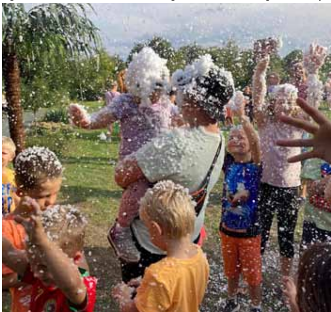
Letní sněhová vánice

Protože vranovickým dětem se nástup do školy o dva dny odložil a do toho vstoupil víkend, proběhlo rozloučení s prázdninami v sobotu 3. září v parku za Domem pro seniory.