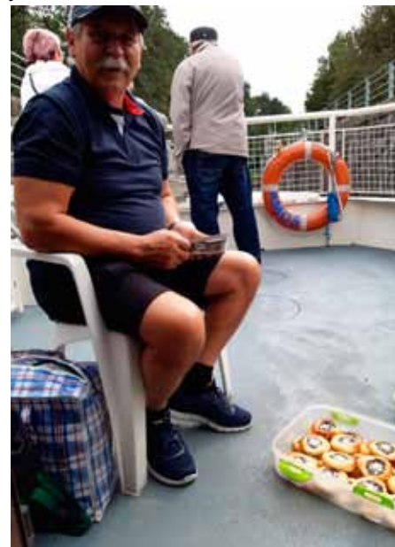
Proviant na cestu

Cesta domů ubíhala ale autobus trochu zlobil, nechtělo se mu do stoupání, doplňovala se nafta u čerpacích stanic, z dálnice jsme proto sjeli na okresní silnici, kdyby náhodou klekl. Ale dostali jsme se šťastně domů do Vranovic.