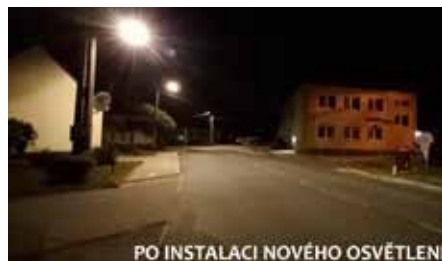
PO INSTALACÍ NOVÉHO OSVĚTLENÍ

Denně bylo vyměněno okolo 30 svítidel, celkem se vymění 330 svítidel. Výměnu realizovala společnost Gamaku a cena investice, která by měla být financována z dotačního titulu, je 3,5 mil. Kč bez DPH.