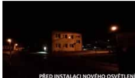
PŘED INSTALACÍ NOVÉHO OSVĚTLENÍ

Během října došlo v obci k výměně veřejného osvětlení. Stávající energeticky náročné výbojky byly nahrazeny za úsporná LED svítidla.