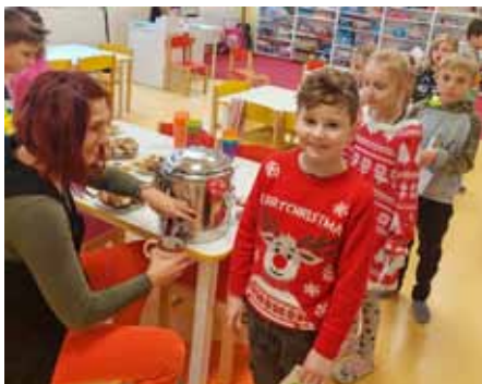
Děti ze ŠD kolečko

Sněhu bylo dost, a tak jsme si lyžování mohli užívat. Začátečníci se učili na mírném kopečku, ti zkušenější trénovali jízdu na prudším svahu. V místním bufetu jsme si také mohli koupit různé sladkosti a občerstvení. Celý výcvik vyvrcholil pátečními závody. Všichni jsme byli odměněni medailí a sladkostí a moc jsme si to užili.