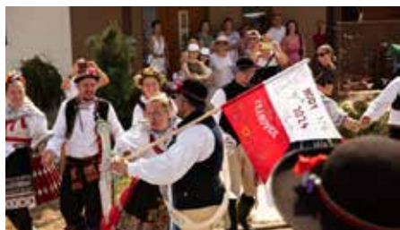
Tanec se starostkou

Tradiční Vranovické hody se letos mimořádně vydařily. Díky úsilí stárků, dobrovolníků, ale i pěknému počasí jsme v sobotu 17. srpna přivítali 600 návštěvníků, kteří si užili skvělou atmosféru. Velké díky patří všem, kteří se na přípravě a průběhu hodů podíleli.